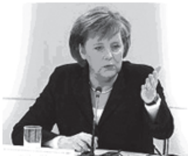
Kancelarja gjermane Angela Merkel

Kancelarja gjermane Angela Merkel, vendi i së cilës ka kryesinë e radhës të Bashkimit Evropian, i bëri thirrje komunitetit ndërkombëtar që të jetë i bashkuar për të përballuar sfidat globale. Në hapje të një konferencë të nivelit të lartë për sigurinë globale, zonja Merkel i bëri thirrje Ruisë që të bashkohet me përpjekjet për ta bërë botën më të sigurt. Ndërkohë presidenti rus paralajmëroi kundër militarizimit të hapësirës.