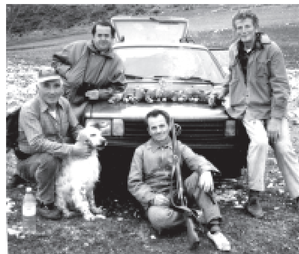
Veri në qendër